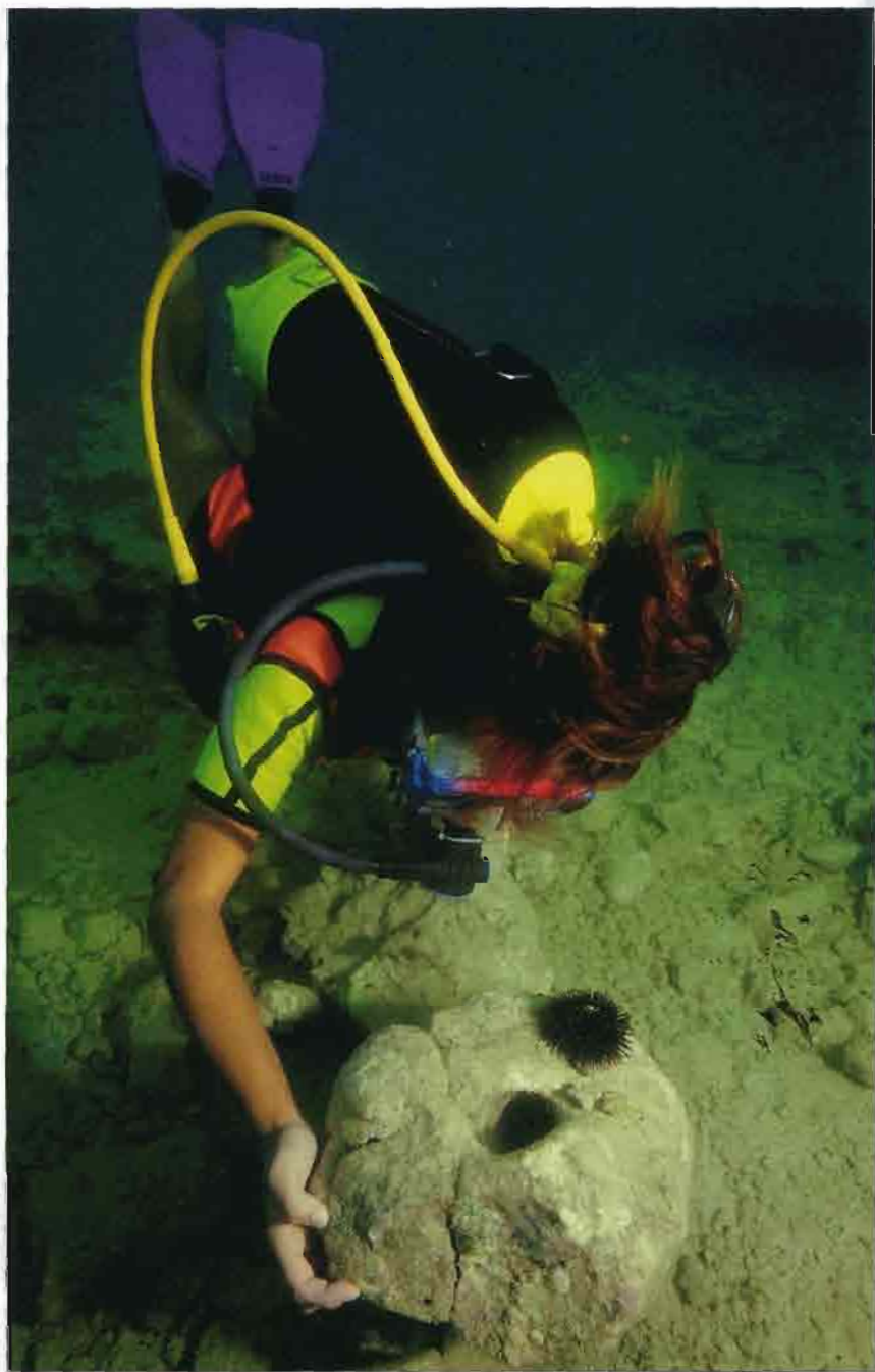
E' stato forse in seguito ad alcuni scavi condotti su una nave naufragata in zona che sono venute alla luce le strutture sommerse di Torre Ovo, che richiamano alla mente macine, pietre forate e frustuli.

Con minore grado di probabilità si potrebbe trattare di calchi di riempimento di gigantesche marmitte di erosione, ma in questo caso resterebbe a mio avviso da spiegare la curiosa conformazione di quei tubuli, apparentemente cavi, che