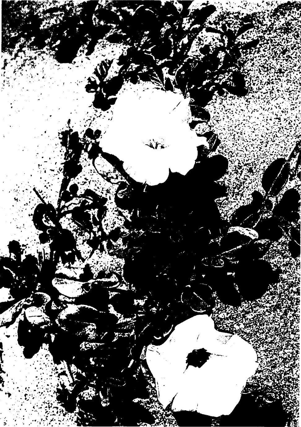
Fig. 3. Particulier de la floraison d' Ipomoea imperati (Vahl) Grisebach près de l'embouchure du fleuve S. Léonard.