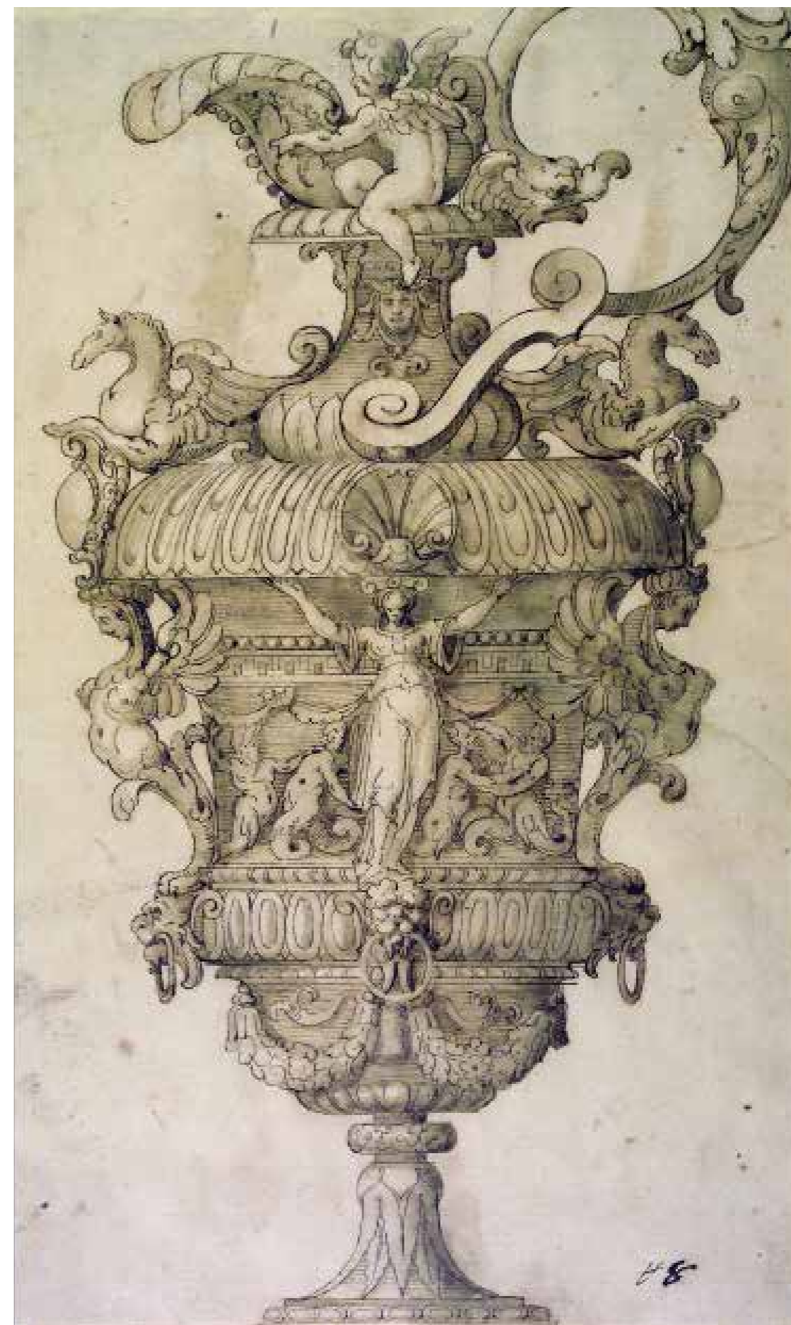
14. Cerchia di Mariano Smiriglio Vaso (disegno) , inizi del XVII secolo Palermo, Galleria Regionale della Sicilia di Palazzo Abatellis (inv. 1565/18)