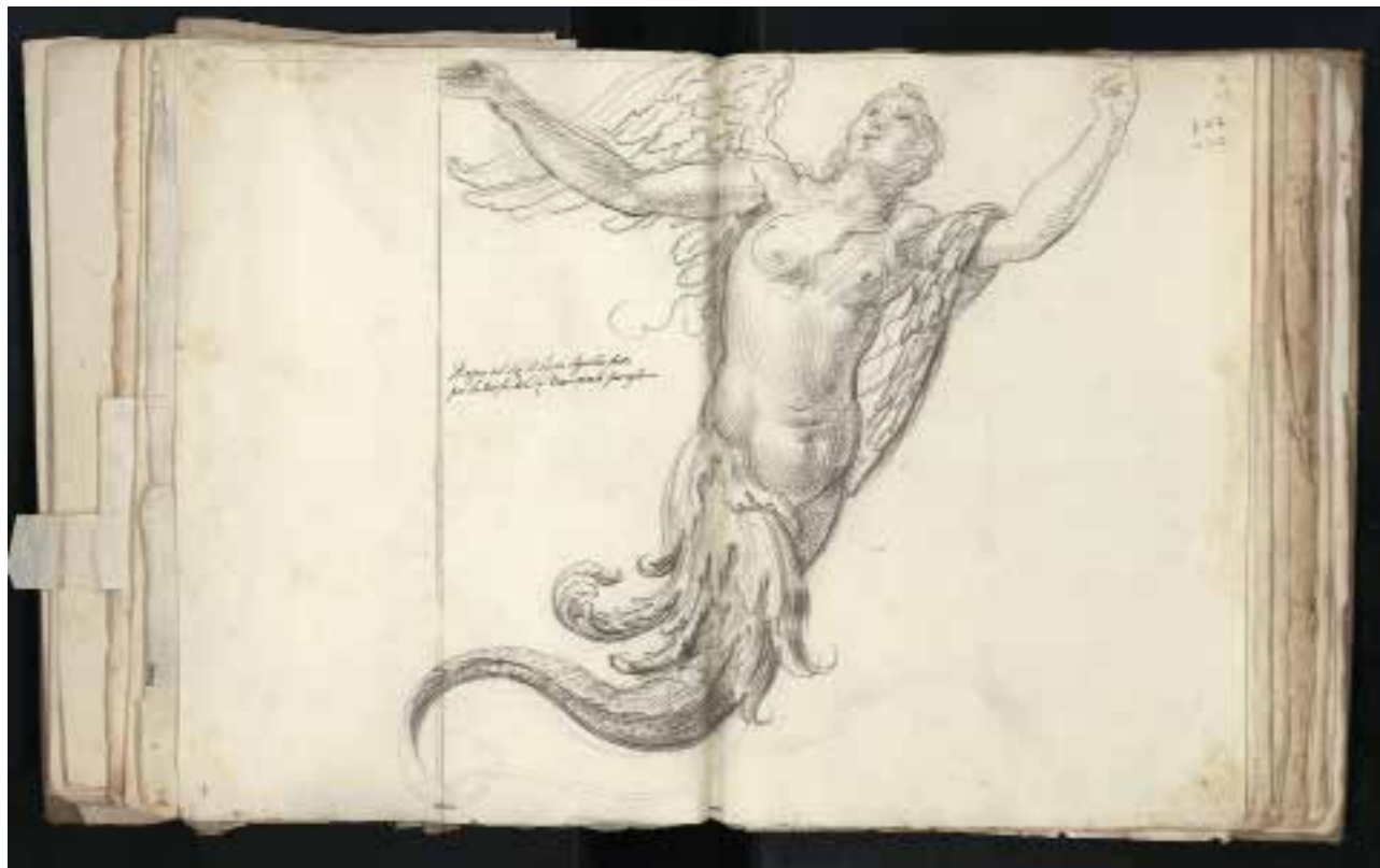
9. Pietro Aquila Studio di una torciera, seconda metà del XVII secolo Palermo, Galleria Regionale della Sicilia di Palazzo Abatellis (inv. 158)