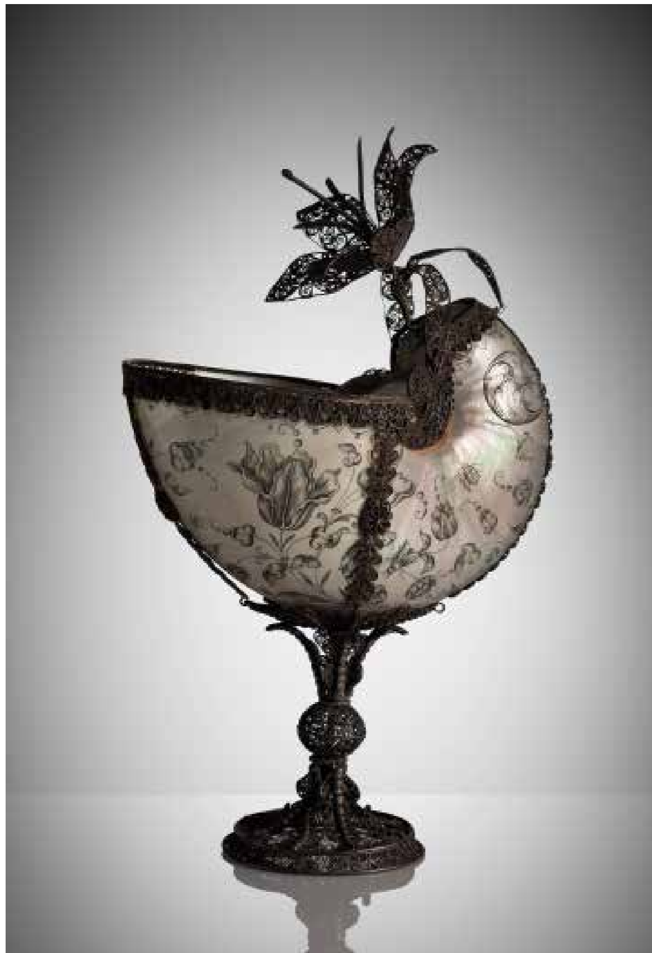
11. Maestranze tedesche o fiamminghe e siciliane Coppa in conchiglia di nautilus , fine del XVI - metà del XVII secolo Palermo, Galleria Regionale della Sicilia di Palazzo Abatellis (inv. 8230)