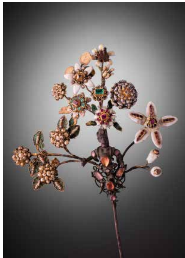
6. Orafo siciliano Pendente con aquila e Cupido , prima metà del XVII secolo Trapani, Museo Regionale "Agostino Pepoli" (inv. 1777)