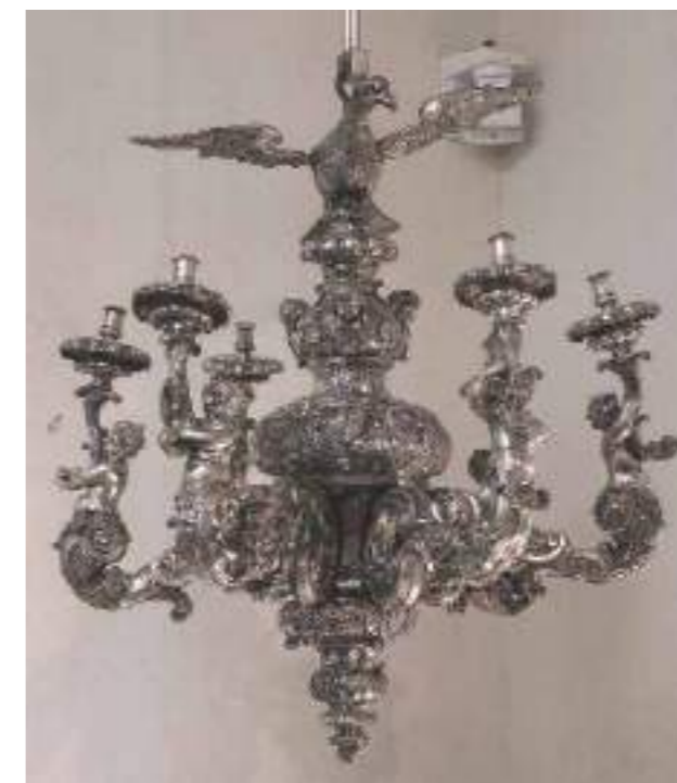
10. Argentieri messinesi Lampadario, 1715 Messina, Museo Regionale Interdisciplinare (inv. A. n. 72)