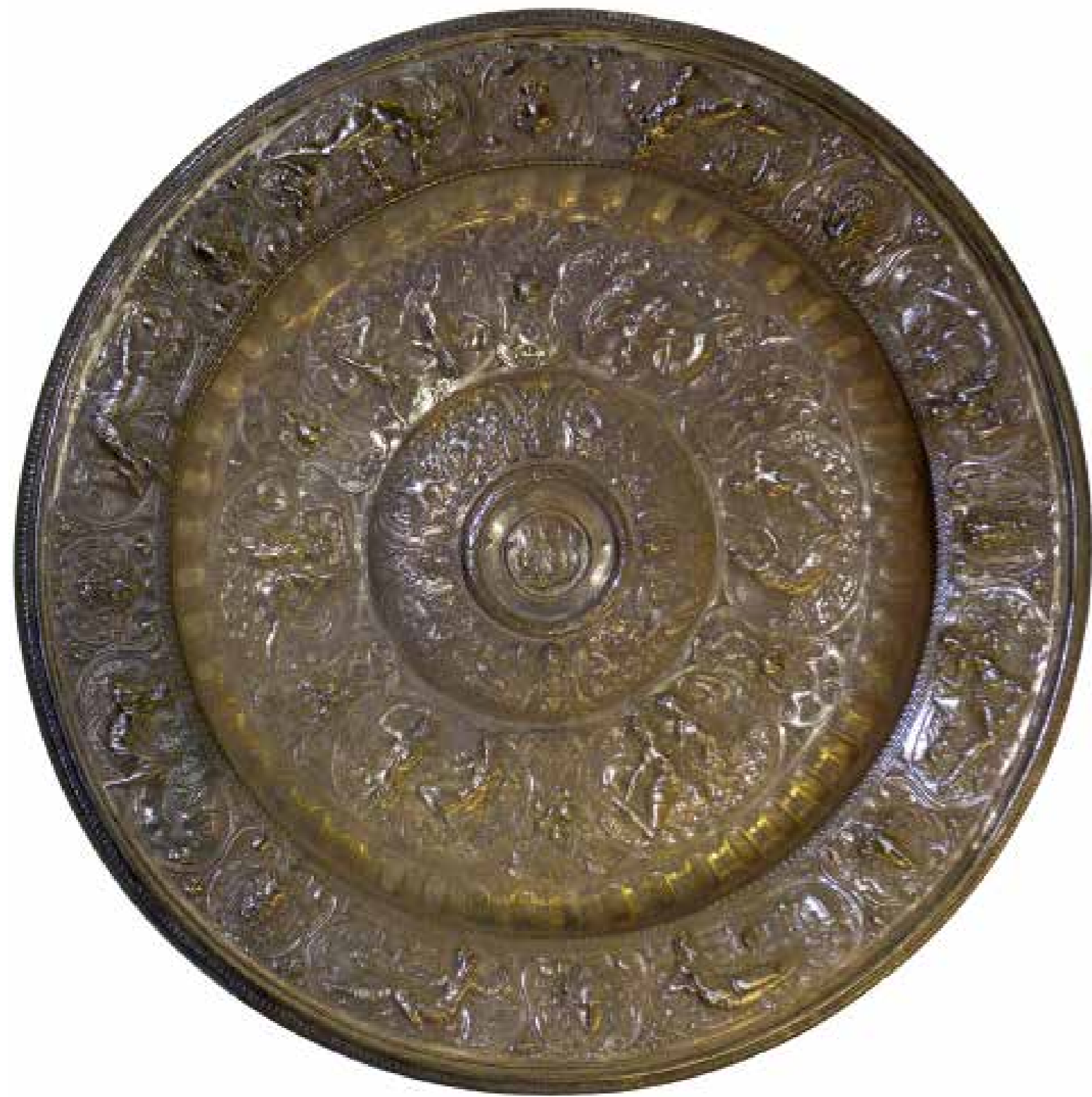
13. Elias Lencker Bacile , ante 1578 Trapani, Museo Regionale "Agostino Pepoli" (inv. 449)