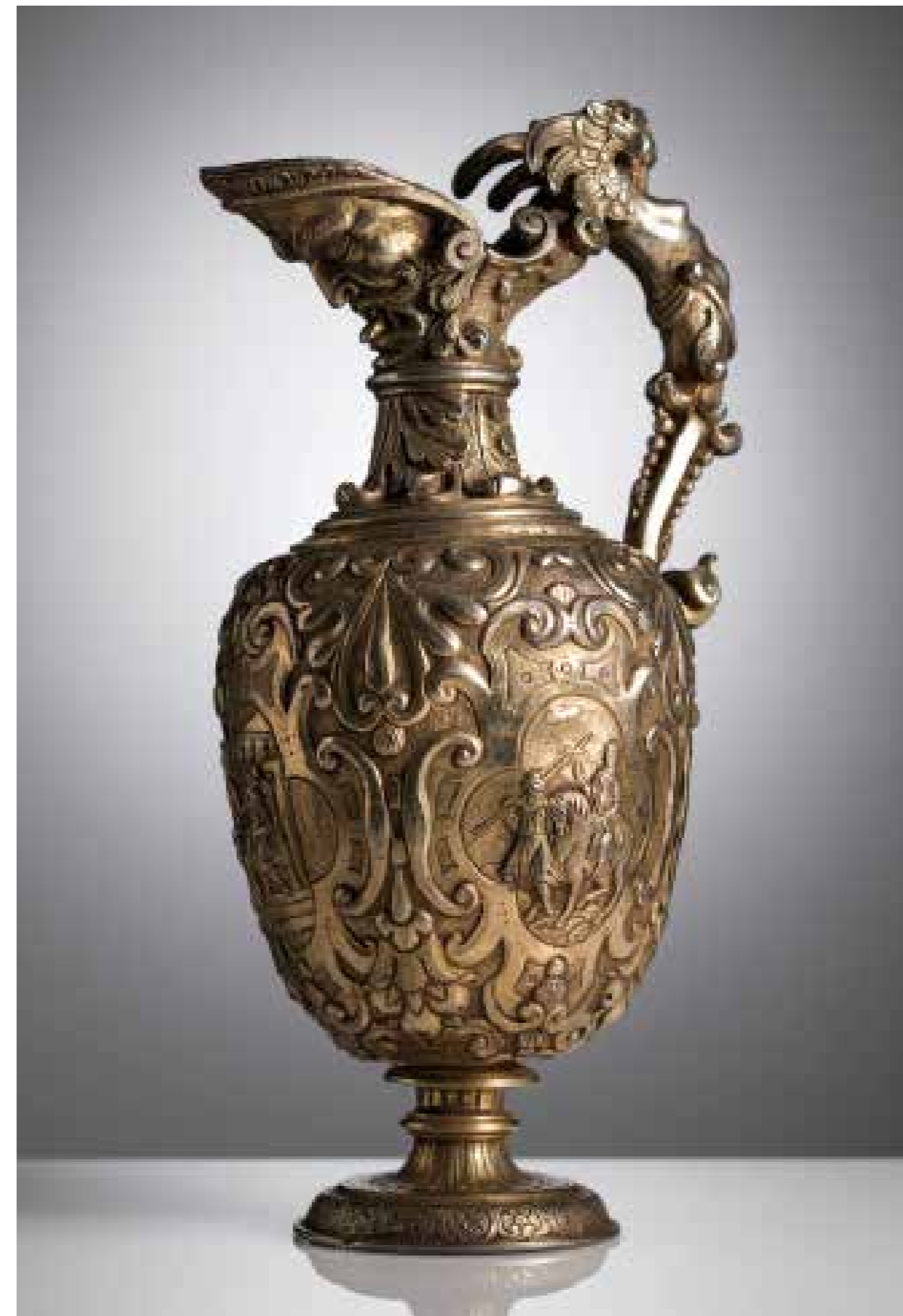
12. Argentiere di Augsburg Acquamanile con bacile , prima metà del XVII secolo Palermo, Galleria Regionale della Sicilia di Palazzo Abatellis (inv. 8224-8225)