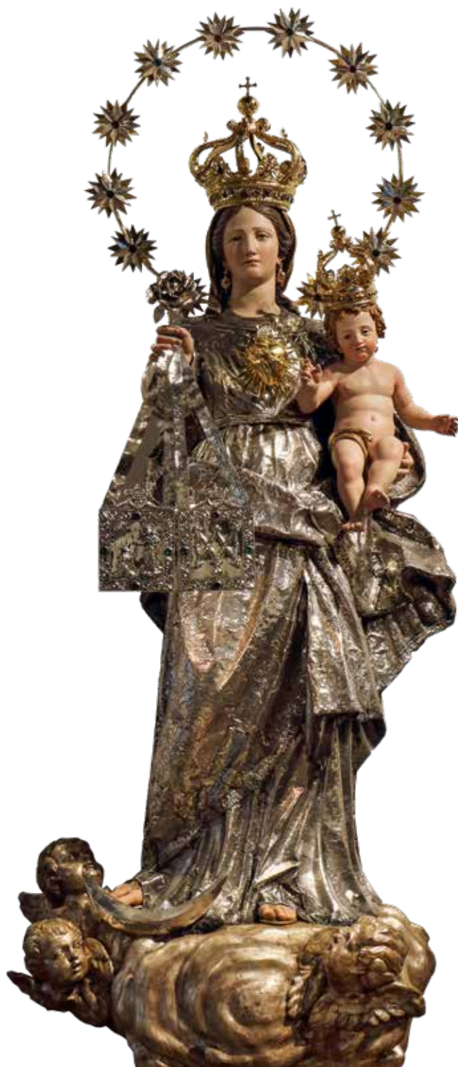
Fig. 3. Giuseppe Castronovo, Domenico Russo, anonimi argentieri, scultori siciliani e Girolamo Bagnasco, Madonna del Carmelo , argento sbalzato e cesellato con parti fuse, legno policromo e dorato, XVII-XIX secolo, Palermo, chiesa del Carmine Maggiore.