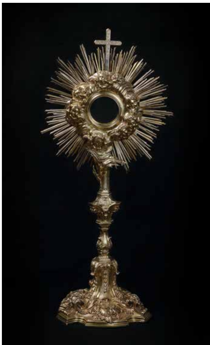
Fig. 1. Pietro Saverio Martinez, Ostensorio , argento sbalzato e celsellato, 1762, Palermo, chiesa del Carmine Maggiore.

lermitana della seconda metà del Settecento in cui «le esuberanze del rococò europeo sono contenute entro schemi geometrici che organizzano le forme e le ordinano secondo una tendenza classicheggiante che non cessa mai di caratterizzare l'arte della città siciliana» 16 . Maria Accascina, infatti, nel suo fondamentale volume Oreficeria di Sicilia scrive: «Nel '700 argentieri e orefici prendono parte attiva alla vita artistica della città e agli eventi tristi e lieti che vengono ugualmente celebrati con pompe e festini» 17 . L'ostensorio afferisce, dunque, a quella tipologia di suppellettili in stile rocaille in genere costituita, come in questo caso, da base mistilinea